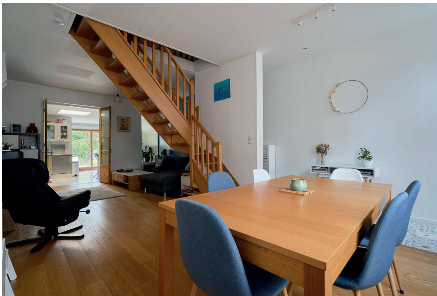
MAISON 1930 96 M2 WASQUEHAL